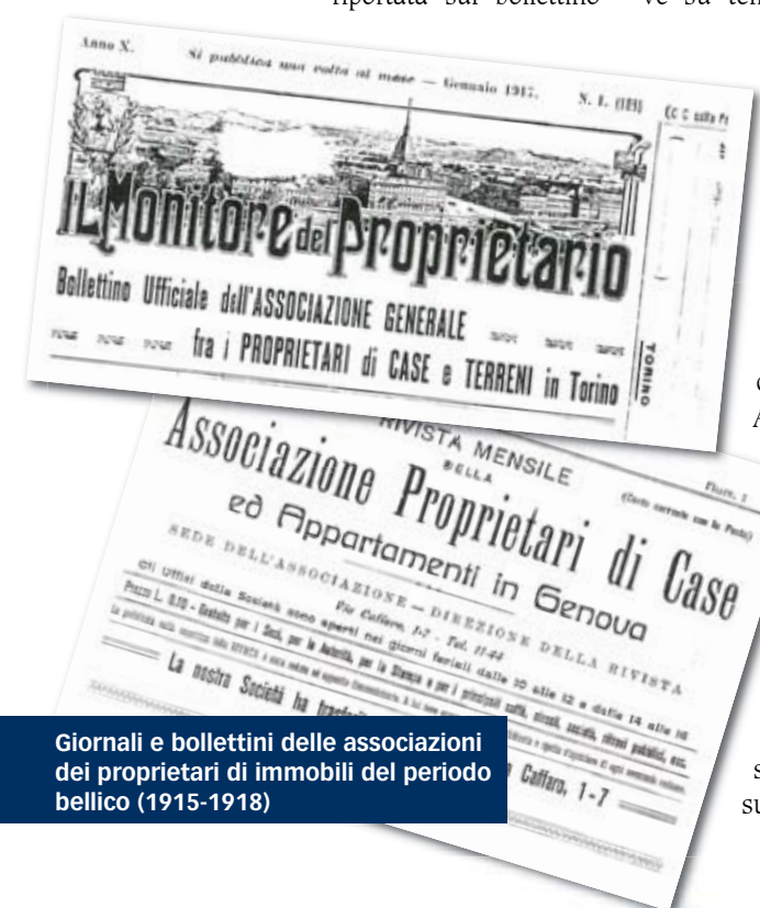
Giornali e bollettini delle associazioni dei proprietari di immobili del periodo bellico (1915-1918)

Si sentiva urgente costituire l'unione per tutelare i propri interessi (non solo economici, ma più in senso generale politici) di fronte ad azioni di coordinamento ed associative che da parte loro