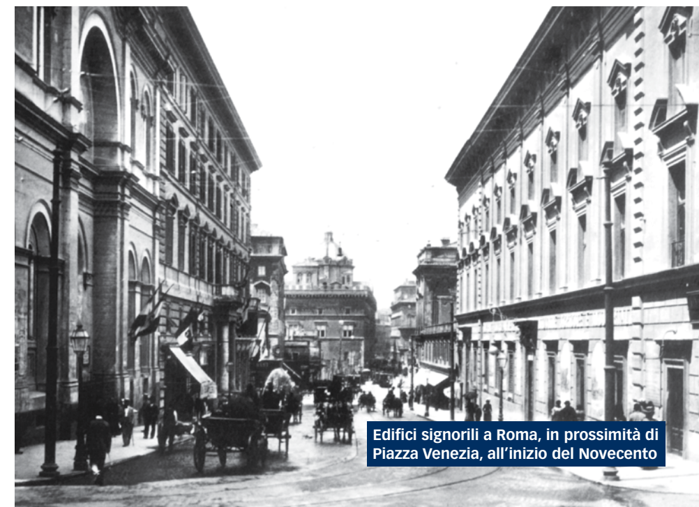
Edifici signorili a Roma, in prossimità di Piazza Venezia, all'inizio del Novecento