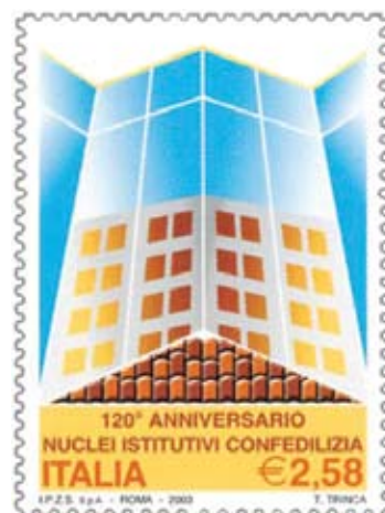
Il francobollo dedicato ai 120 anni di Confedilizia nel 2003

La dizione usuale era quella di «Associazione dei proprietari di casa di ...»; in qualche caso «Associazione dei proprietari