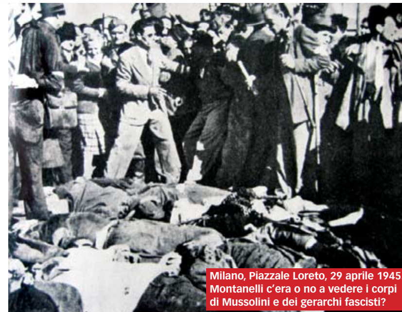
Milano, Piazzale Loreto, 29 aprile 1945. Montanelli c'era o no a vedere i corpi di Mussolini e dei gerarchi fascisti?