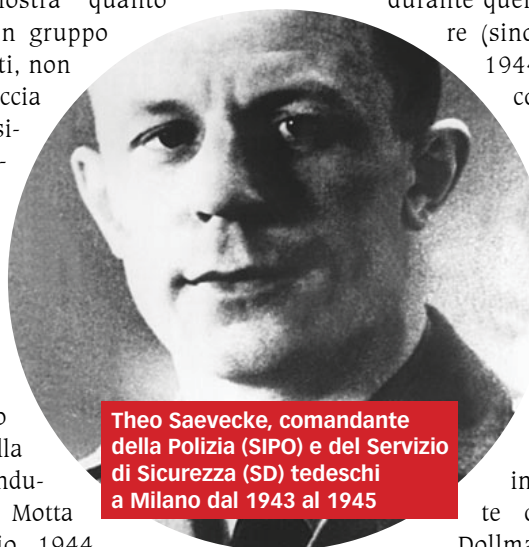
Theo Saevecke, comandante della Polizia (SIPO) e del Servizio di Sicurezza (SD) tedeschi a Milano dal 1943 al 1945

2) Al momento dell'arresto, a Pella, sul lago d'Orta, nella villa dell'industriale Mario Motta il 5 febbraio 1944,