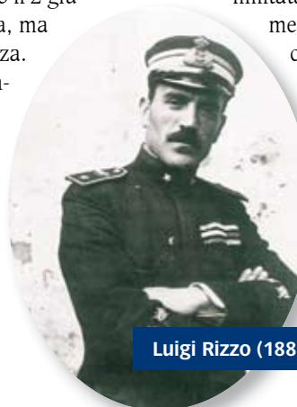
Luigi Rizzo (1887-1951)