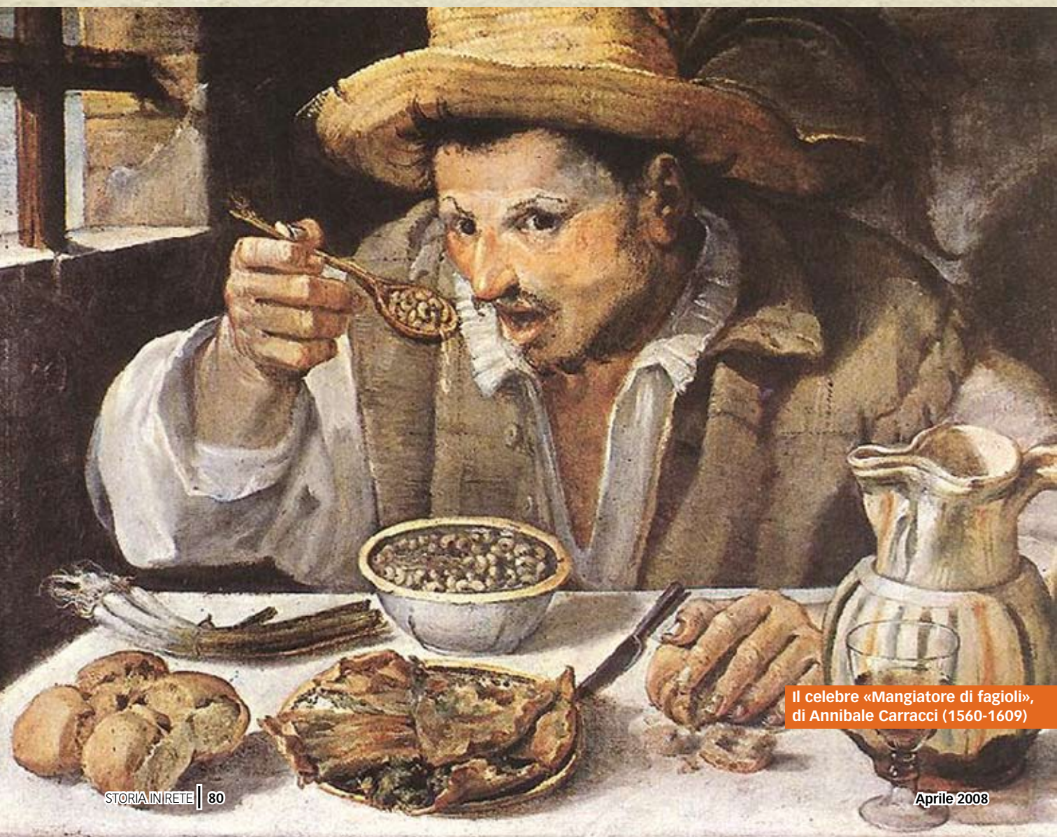
Il celebre «Mangiatore di fagioli», di Annibale Carracci (1560-1609)

P repariamoci a questo viaggio con le avvertenze del caso. Qui non si tratta di ottenere visti, timbrare il passaporto, sottoporsi a specifiche profilassi, ma di identificare al meglio l'intento del nostro percorrere l'Italia. (...)