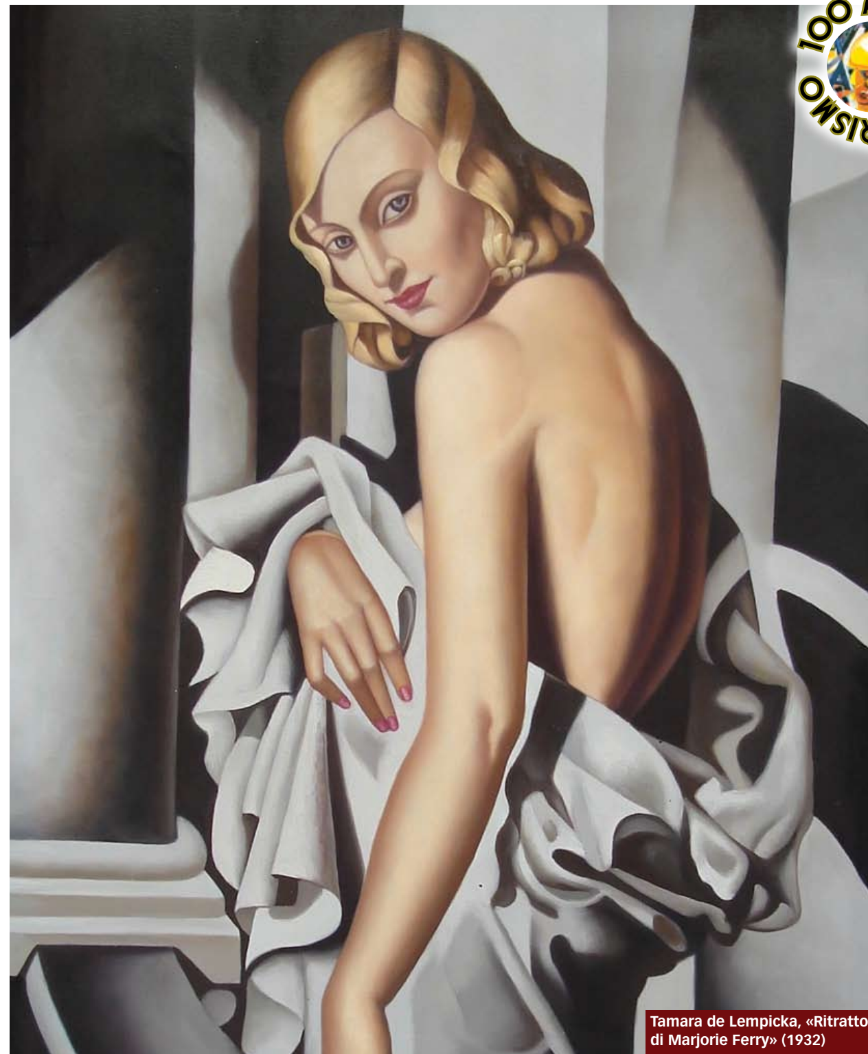
Tamara de Lempicka, «Ritratto di Marjorie Ferry» (1932)

addirittura buffo. Il che rende difficile dedicarsi alla lettura dei romanzi di Edith. Eppure il suo romanzo più noto, «Una donna con tre anime» (del 1918), è interessante per più di un motivo: vi si racconta delle surreali peripezie di un'anonima e insignificante casalinga, Giorgina Rossi, che sperimenta, per un'alterazione psichica dovuta a una contaminazione magnetica, tre personalità molto diverse dalla sua: una sensualità libera e amorale, un imprevisto temperamento virile e creativo che apre orizzonti del tutto nuovi alla protagonista, e doti di preveggenza, arricchite da «nuovi sensi irradiati immaterialmente nell'Infinito».