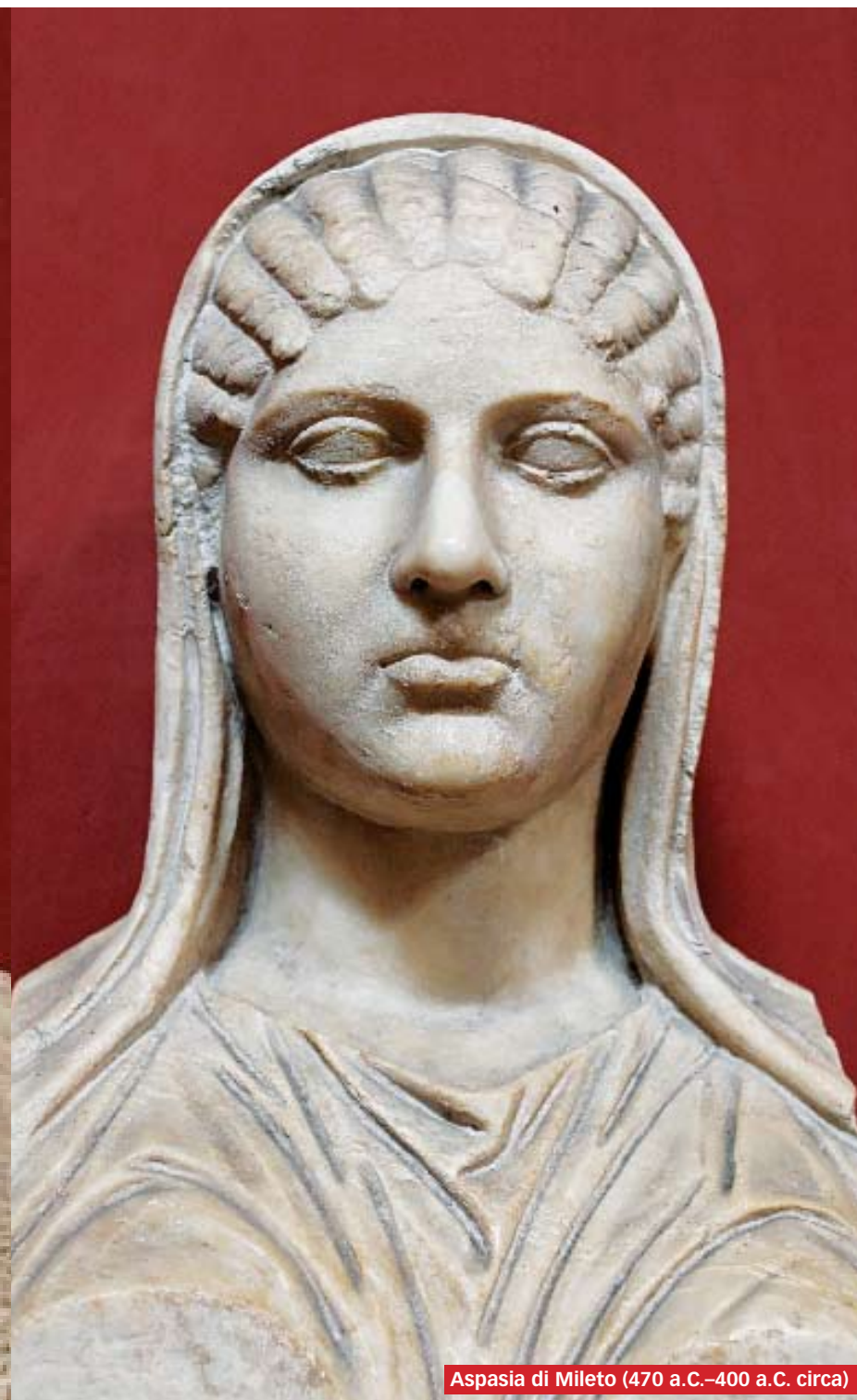
Aspasia di Mileto (470 a.C.-400 a.C. circa)

L e donne non devono far parlare di sé. Questa era la norma etica generale a cui le donne dell'antichità classica dovevano conformarsi. È singolare allora notare con quanta frequenza il nome di Aspasia di Mileto faccia capolino tra le fonti relative alla storia ateniese. Sorge quindi una domanda stuzzicante: perché la sua figura spiccava in mezzo all'anonimato che caratterizzava l'universo femminile dell'antichità? Aspasia nacque a Mileto, in Asia Minore (odierna Turchia), intorno alla prima metà del V secolo a. C. Da qui si trasferì ad Atene, dove sarebbe diventata l'amante di Pericle, leader incontrastato della politica ateniese. Memori della prodigiosa ascesa politica di certe nostre politiche in erba, si potrebbe essere istintivamente portati a concludere che Aspasia sia diventata famosa grazie alle sue liaisons dangereuses con il potere. Dello stesso avviso erano i poeti comici dell'epoca, quotidianamente impegnati a bacchettare la moralità allegra di Aspasia, che veniva apostrofata con carinerie quali «avida prostituta» o «concubina faccia di cagna». Insomma, la Guzzanti al confronto è una scolaretta pudica.