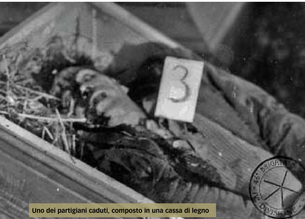
Uno dei partigiani caduti, composto in una cassa di legno