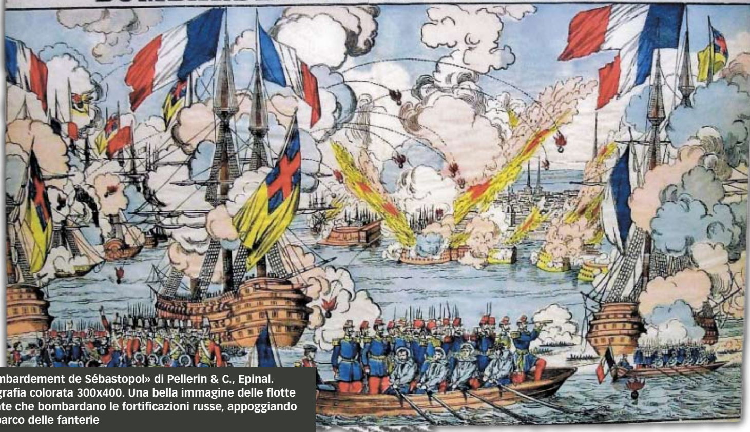
«BombardeMENT de Sébastopol» di Pellerin & C., Epinal. Litografia colorata 300x400. Una bella immagine delle flotte alleate che bombardano le fortificazioni russe, appoggiando lo sbarco delle fanterie

testimonianza: informano le famiglie su quanto accade ai loro congiunti, soldati in terra straniera; divertono adulti e bambini con le loro «cantate» patriottiche, eroiche, sentimentali o satiriche, con i giochi da tavola e, per mezzo dei leggendari soldatini di carta dalle pittoresche eleganti uniformi, insegnano a conoscere gli eserciti in lotta. E' tutto un mondo di informazioni contiguo e parallelo a quello togato delle comunicazioni ufficiali, e certamente di