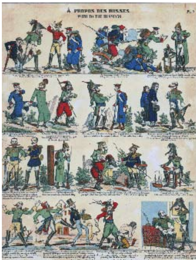
«À propos des Russes - With to the Russians». Fabrique d'Estampes de Gangel, Metz, New-York J. Lechevallier. Planche 3. Litografia acquarellata a mano e dorata, 470x350. Immagine satirica a scapito del soldato russo. Era bilingue, in francese e inglese

riprodotte le ventidue lettere dell'alfabeto con una suggestiva carrellata delle uniformi di entrambi gli eserciti combattenti: è buona l'attendibilità uniformologica; non mancano le immagini della regina Vittoria d'Inghilterra, dello zar russo Nicola, del Sultano Abdul-Medjid, imperatore di Turchia, del Sultano dei Circassi e dei comandanti delle varie armate, mentre è stranamente assente l'imperatore francese Napoleone. Mancano anche i rappresentanti piemontesi, il che permette di datare questa immagine ad un periodo anteriore al gennaio 1855, quando il Regno di Sardegna aderisce ufficialmente alla alleanza anglo francese.