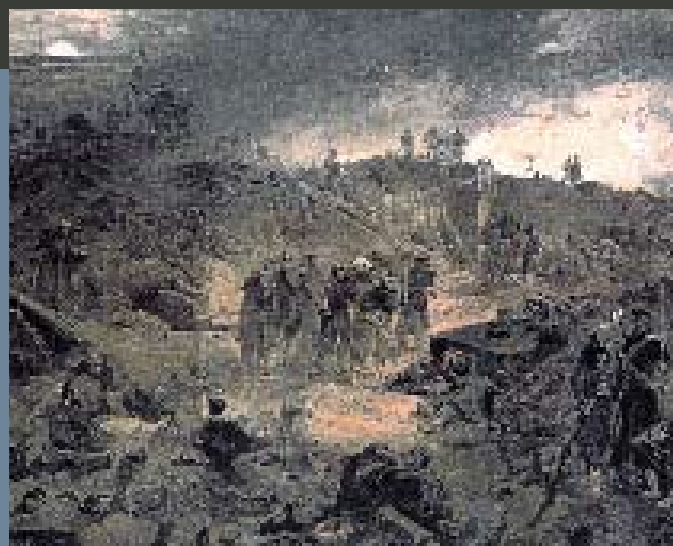
Tavola litografica intitolata «Interior of the Malakoff with the remains of the Round Tower», di W. Simpson, (365x550 mm) dove sono rappresentate le terribili conseguenze del bombardamento contro il forte russo durante l'assedio alleato

N el 1854 il motivo apparente della guerra fra l'impero russo e l'alleanza occidentale è l'impegno dello zar Nicola I a difesa della chiesa ortodossa nella disputa con i monaci cattolici sostenuti dalla Francia per la custodia della Chiesa della Natività di Betlemme. In realtà lo zar, convinto della potenza e della eccellenza del suo esercito, ritiene sia giunto il momento di estendere il suo impero con la conquista di un accesso ai mari europei attraverso lo stretto dei Dardanelli, territorio della Sublime Porta Turca: è l'antico sogno dei Romanoff di umiliare definitivamente l'arroganza turca e raggiungere «un mare caldo e sicuro». La guerra inizia nei cosiddetti territori danubiani posseduti dai turchi; i russi, sconfitti, si ritirano verso i loro territori della Crimea. Il conflitto si estende ed entrano in campo gli inglesi, i francesi e più tardi i piemontesi a sostegno dei turchi; si incentra nella penisola di Crimea dove la città fortificata di Sebastopoli ne rappresenta la punta di diamante. La sua caduta nell'autunno del 1855 rappresenta la fine della guerra