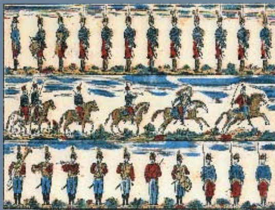
Soldatini di carta prodotti da Remondini, Bassano, nella prima metà del XIX secolo. Fanti, ussari e banda militare. (Prima striscia la fanteria, al centro la cavalleria, in basso la banda militare). Silografia colorata a maschera 356 x 460

N ella seconda metà del XVIII secolo nascono a Parigi e nella città tedesca di Augusta i primi soldatini di carta. Presto la capitale di queste figure stampate, ritagliate ed incollate su cartoncino per permettere i giochi della guerra, diventa Strasburgo, città di frontiera, città coccardiere, patriottica per eccellenza, dove le armate napoleoniche sono in continuo passaggio. In Italia sono i Remondini di Bassano del Grappa, i più importanti editori italiani dell'ottocento, a porre fra le loro eleganti pubblicazioni anche i soldatini di carta. Nascono come un gioco infantile, ma fino dalla loro prima