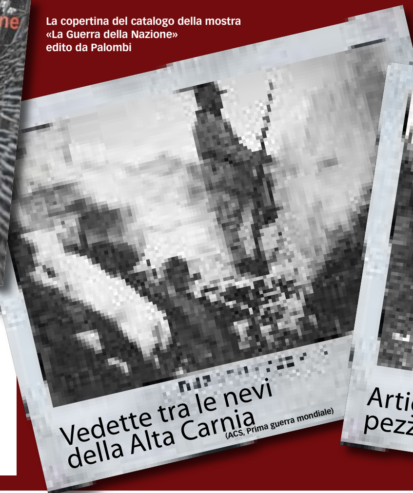
Vedette tra le nevi della Alta Carnia