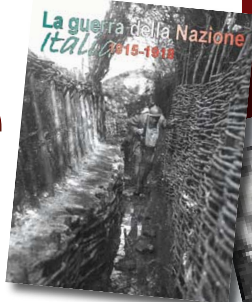
La copertina del catalogo della mostra «La Guerra della Nazione» edito da Palombi

Ma poi, come si sa, anche quelli che non erano stati d'accordo andarono al fronte e si batterono. Con impegno, con caparbità, con rabbia. Assai spes-