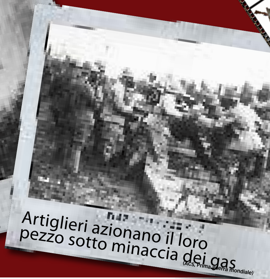
Artiglieri azionano il loro pezzo sotto minaccia dei gas (ACS, Prima guerra mondiale)