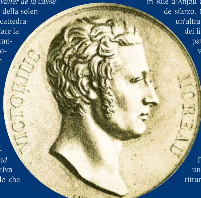
Medaglia commemorativa fatta coniare dallo Zar in ricordo di Moreau, caduto combattendo contro Napoleone assieme ai russi

In effetti, Moreau, un tempo uomo austero, adesso amava la vita splendida, il lusso e la buona tavola, ed oltre alle terre di Gros Bois aveva acquistato una elegante casa in Rue d'Anjou che aveva arredato con grande sfarzo. Nel maggio del 1802 scoppiò un'altra crisi, la cosiddetta «congiura dei libelli». A Rennes furono stampati dei manifesti che esortavano l'esercito a «uccidere il tiranno» ed erano pronti per essere inviati a Parigi nascosti in vasi di terracotta solitamente usati per il burro. Sospettato e interrogato dal capo della polizia Fouché, Moreau rispose irridente: « Mais c'est la conspiration de pots de beurre! ». La battuta fece il giro dei salotti di Parigi e scatenò in Bonaparte una collera furiosa: voleva addirittura sfidare a duello quell'insop-