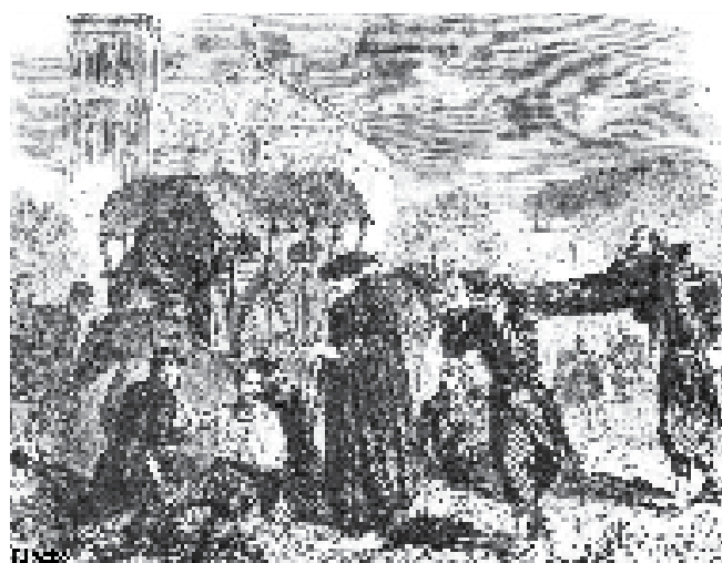
Il soccorso ai feriti della battaglia di Solferino e San Martino, il 24 giugno 1859 da «Le Monde Illustré» del 1859

morti, 12.512 feriti e 2.922 prigionieri o dispersi fra i franco-piemontesi e 3.000 morti, 10.807 feriti e 8.638 prigionieri o dispersi fra gli austriaci) e la disorganizzazione delle Intendenze Militari nel recupero e nella cura dei feriti. Dunant scelse di partecipare personalmente all'opera di soccorso. Migliaia di feriti furono trasportati nella vicina Castiglione delle Stiviere dove ricevettero le cure delle donne del posto e dove chiese, scuole e case private furono messe a disposizione come ospedali temporanei. Le impressioni di Dunant, la sua esperienza e le sue proposte furono raccolte nel libro «Un ricordo di Solferino», da lui pubblicato poco tempo dopo.