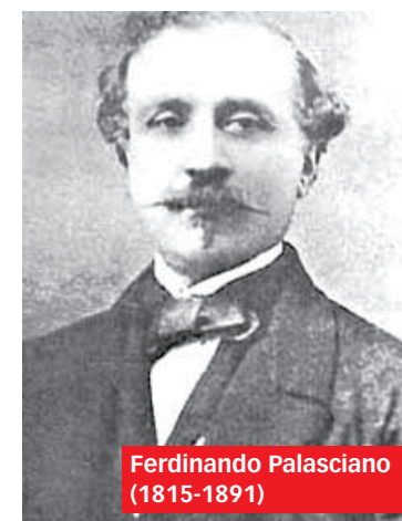
Ferdinando Palasciano (1815-1891)

Croce Rossa. L'idea di mettere insieme le competenze e le risorse delle Società di Croce Rossa organizzando l'assistenza umanitaria in tempo di pace, e non di prepararsi solo all'aiuto durante la guerra, risale ancora a Dunant che scrisse nel 1862: «Queste società potrebbero anche fornire un grande opera attraverso la loro