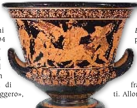
Il cratere di Eufronio, recentemente restituito dal Metropolitan Museum di New York all'Italia

Triste destino , quello dell'arte italiana, oggetto di razzie continue (altro che lanzichenecchi a Roma) che tra il 1970 e il 2004 hanno coinvolto migliaia di tombaroli e musei alla caccia di un patrimonio unico, che privato del suo passato, si è trasformato in testimonianza muta. L'inchiesta di Fabio Isman, firma del «Messaggero»,