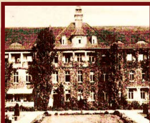
L'Ospedale Ebraico di Berlino all'inizio del XX secolo

le autorità naziste rasantava l'incredibile. I russi erano inciampati nell'ultima riserva ebraica in Germania, e in una straordinaria storia di sopravvivenza. Una storia che dopo anni ed anni ancora pochi sono coloro che riescono o vogliono raccontare. Perché è ancora un mistero su come ciò possa essere accaduto: chi erano questi sopravvissuti? E quali potevano essere i sinistri scopi di Hitler nel lasciarli salva la vita? Fra questi ottocento uomini e donne c'erano storie personali d'ogni genere: c'erano i più coraggiosi fra i coraggiosi, i fortunati e i furbi. C'erano collaborazionisti e spie. C'erano anche ebrei «privilegiati», sposati con tedeschi di razza ariana. Ma ancora più misteriosamente, c'erano ebrei che erano protetti dai nazisti di rango più elevato. Poco si sa di loro, poiché i documenti che li riguardavano sono stati bruciati dalla Gestapo pochi giorni prima dell'arrivo dei russi.