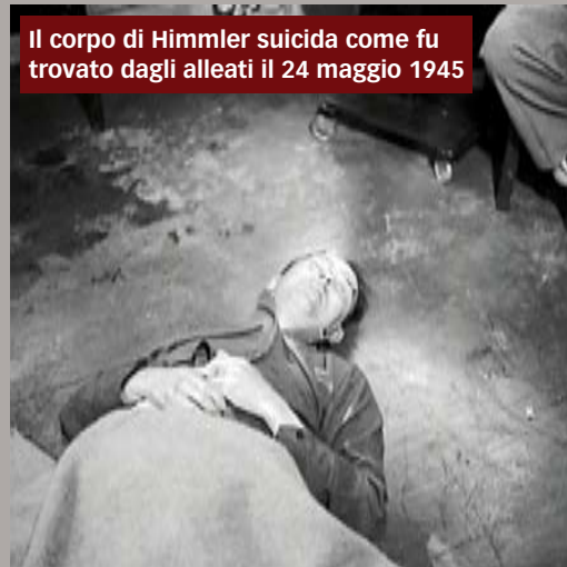
Il corpo di Himmler suicida come fu trovato dagli alleati il 24 maggio 1945

mentre secondo altri si era riciclato come medico in un ospedale berlinese occupato dagli alleati. Uno sterminato numero di testimonianze, poi, attesterebbe che Lustig sarebbe stato quasi subito catturato dai cacciatori di criminali di guerra sovietici. Sebbene non ci siano prove reali, pare che abbastanza plausibilmente Lustig sarebbe stato denunciato, condannato per collaborazionismo e fucilato. Senz'altro avrebbe potuto rivelare l'intera storia dell'Ospedale Ebraico, e i dettagli del suo personale accordo con Eichmann, che avrebbe orripilato le vittime del nazismo. D'altro canto per molte delle persone sulla Lista B la sua prematura scomparsa significò sollievo: avrebbe portato con sé nella tomba il segreto delle loro identità. L'altro uomo che avrebbe potuto rivelare la verità sull'ospedale non fu mai interrogato a tal proposito. Questo problema fu considerato tutto sommato eccentrico rispetto al principale capo d'imputazione al processo di Geru-