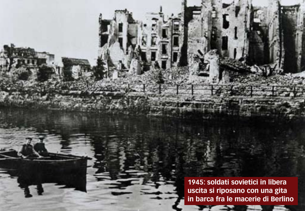
1945: soldati sovietici in libera uscita si riposano con una gita in barca fra le macerie di Berlino

popolazione tedesca nel momento in cui fosserostate note le proporzioni e la realtà della deportazione in massa degli ebrei. E in nessun altro luogo come Berlino, dove gli ebrei erano profondamente integrati in ogni strato sociale della città, questo rischio era imminente. Con un ospedale ebraico in funzione e medici ed infermiere ebraiche attivi nella cura di pazienti ebrei era possibile sostenere la bugia che Hitler non aveva alcuna intenzione di eliminare fisicamente gli ebrei tedeschi. Ma fra gli addetti all'ospedale pochi erano coloro che non immaginavano bene la realtà esterna.