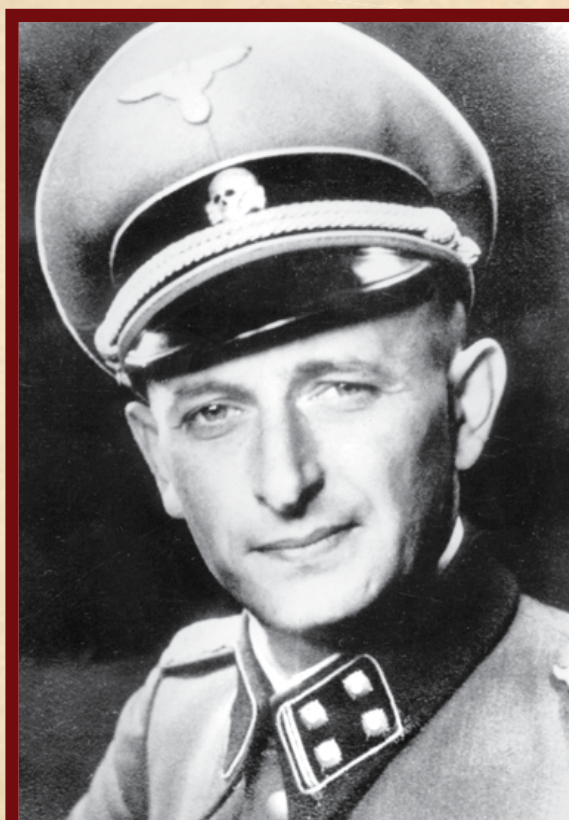
Adolf Eichmann (1906-1962). Probabilmente per suo ordine 800 ebrei furono risparmiati dallo sterminio nel cuore di Berlino

Così, sebbene allo scoppio della guerra l'ospedale sembrasse funzionare normalmente, non si trattava altro che di uno dei tanti strumenti nelle mani di Eichmann. Continuando ad operare, esso servì a disorientare i berlinesi circa il reale trattamento riservato agli ebrei altrove. Gli alti comandi nazisti, ed in particolare il ministro della Propaganda Joseph Goebbels, temevano la possibilità di disordini fra la