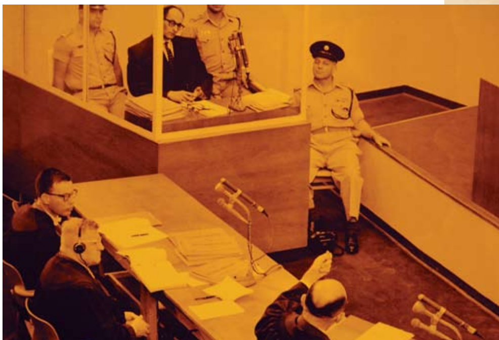
Israele, aprile 1961, il processo ad Adolf Eichmann. Il pubblico ministero Gideon Hausner pronuncia il suo J'accuse . Eichmann è in una gabbia di vetro antiproiettile. Durante il processo non si approfondì il caso dell'Ospedale Ebraico di Berlino