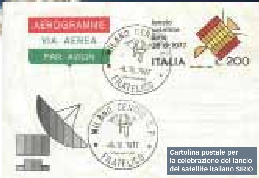
Cartolina postale per la celebrazione del lancio del satellite italiano SIRIO

Nel 1969 l'accordo Intelsat venne rinegoziato, per definire l'assetto permanente del consorzio, e l'Italia fu rappresentata da Telespazio . L'accordo finale venne raggiunto a Washington nel maggio 1971, ed entrò in vigore nel febbraio 1973, con la ratifica del trattato da parte dei due terzi dei Paesi partecipanti. Telespazio continuò a operare come referente italiano della struttura Intelsat . A partire dal 1970, il sistema Intelsat venne ulteriormente potenziato, per consentire alle stazioni di terra di far fronte all'espansione continua delle connessioni via satellite, ma anche per l'avvio di una differenziazione delle attività. Nel maggio 1974 Telespazio firmò un nuovo accordo con la NASA per la ricezione dei dati trasmessi dai satelliti Landsat . Si ebbe in tal modo il decollo del progetto TERRA (Tecniche di Elaborazione e Rilevamento delle Risorse Ambientali), per l'attivazione di un sistema di ricezione, elaborazione, immagazzinamento e ritrasmissione agli utenti coinvolti di dati relativi alle risorse terrestri rilevati dai satelliti. Il