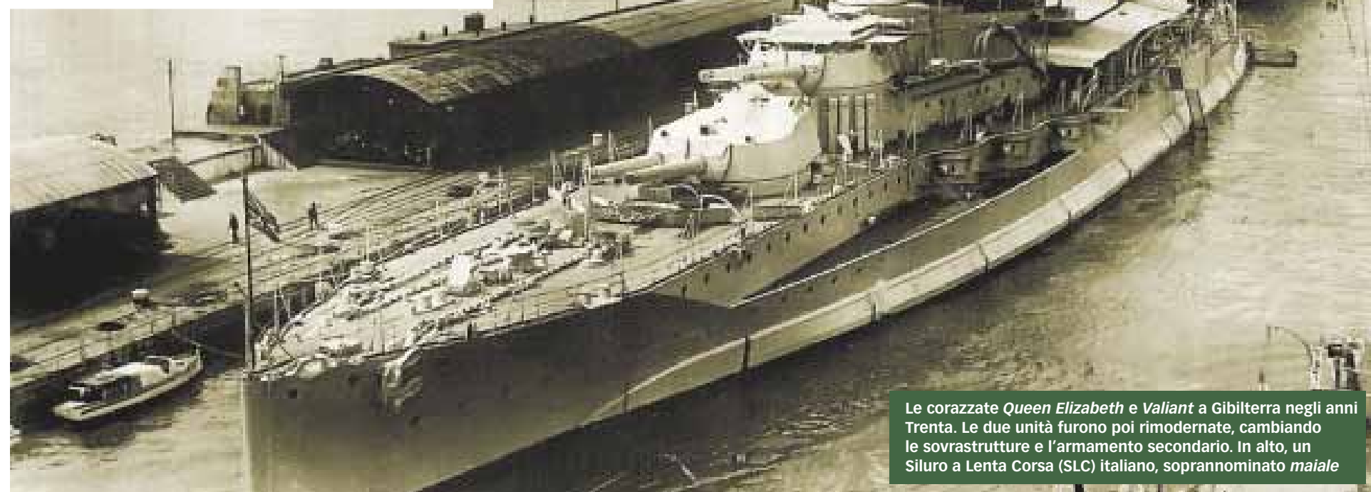
Le corazzate Queen Elizabeth e Valiant a Gibilterra negli anni Trenta. Le due unità furono poi rimodernate, cambiando le sovrastrutture e l'armamento secondario. In alto, un Siluro a Lenta Corsa (SLC) italiano, soprannominato maiale