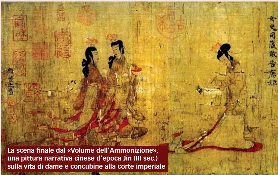
La scena finale dal «Volume dell'Ammonizione», una pittura narrativa cinese d'epoca Jin (III sec.) sulla vita di dame e concubine alla corte imperiale

mente positivo per il dominio romano. Niente di nuovo sotto il sole, dunque. Da un lato più o meno anziani leader alla ricerca di svago e distrazione dalle amarezze della vita di governo e dall'altra nemici implacabili, disposti a diffondere ogni genere di pettegolezzo che – eccitando la morbosità dell'uditore – possa sollevare l'indignazione più o meno ipocrita di chi non ha accesso agli stessi piaceri e privilegi.