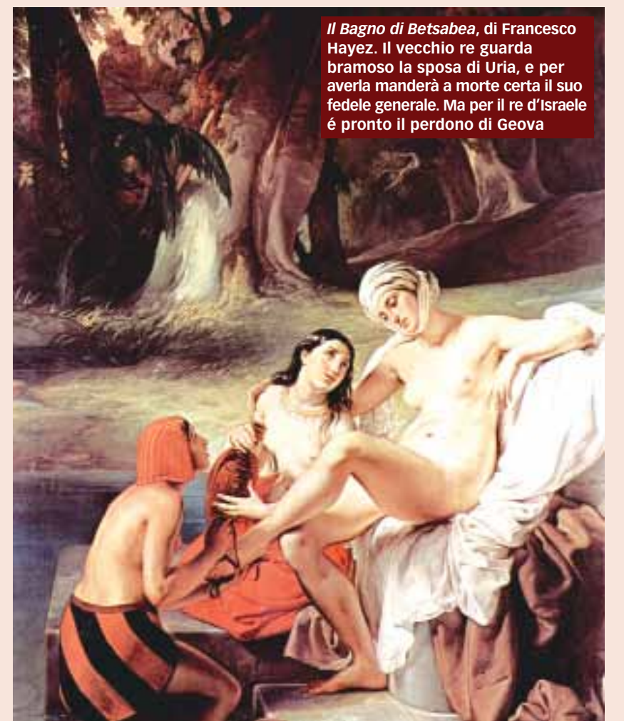
Il Bagno di Betsabea, di Francesco Hayez. Il vecchio re guarda bramoso la sposa di Uria, e per averla manderà a morte certa il suo fedele generale. Ma per il re d'Israele è pronto il perdono di Geova