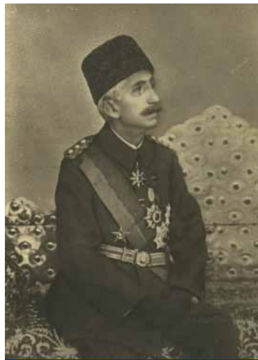
Maometto VI Vahdeddin (1861-1926) fu l'ultimo sultano dell'impero ottomano dal 1918 al 1922 e il centesimo Califfo dell'Islam

Prima il sostegno a Vahdeddin [Maometto VI NdR], considerato prigioniero degli inglesi; poi gli onori tributati