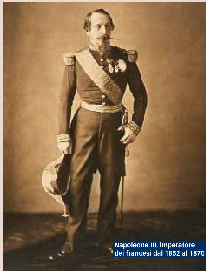
Napoleone III, imperatore dei francesi dal 1852 al 1870

A iutò Vittorio Emanuele II a vincere la guerra contro l'Austria, ma poi mise il piede sul freno dell'unità d'Italia, dicendo che «l'unione» dell'Italia avrebbe richiesto tempo. La sua simpatia per i movimenti liberali e per il Risorgimento italiano non gli impedirono mai di privilegiare gli interessi francesi, dettati dalla geopolitica prima che dall'ideologia. Napoleone III è una delle figure storiche che maggiormente ha influenzato l'Europa, e l'impronta che egli diede all'assetto del Vecchio Continente rimase fino alla Grande Guerra, sopravvivendo per quattro decenni al suo impero. Un personaggio che ora una nuova