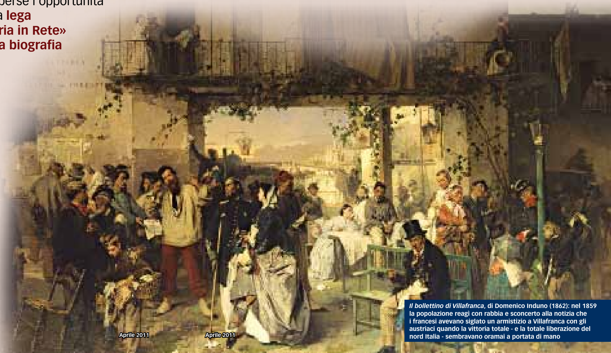
Il bollettino di Villafranca, di Domenico Induno (1862): nel 1859 la popolazione reagì con rabbia e sconcerto alla notizia che i francesi avevano siglato un armistizio a Villafranca con gli austriaci quando la vittoria totale - e la totale liberazione del nord Italia - sembravano ormai a portata di mano

re il confronto con le armate austriache. Sappiamo però che Napoleone intendeva liberare l'Italia dal dominio di