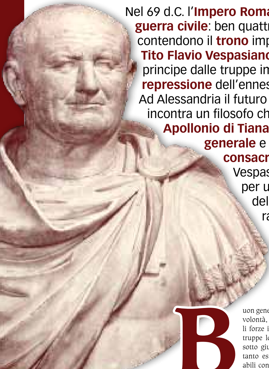
Tito Flavio Vespasiano, (9 d.C. - 79 d.C.), resse l'Impero Romano con fermezza e rigore per dieci anni e fu molto amato dal popolo e dal Senato

« Quanto ai numerosi piaceri che, per così dire, hanno diritto di cittadinanza a Roma, sappili contenere in una intelligente e accorta misura, perché è difficile esigere dal popolo una tempe-