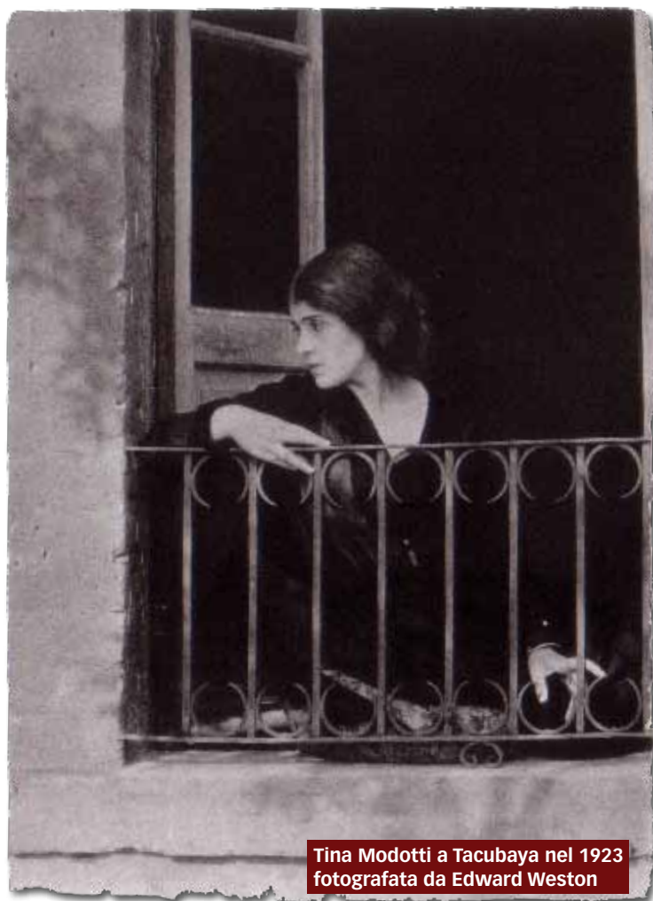
Tina Modotti a Tacubaya nel 1923 fotografata da Edward Weston