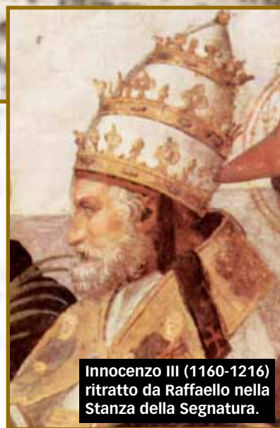
Innocenzo III (1160-1216) ritratto da Raffaello nella Stanza della Segnatura.

rale della sua missione (che univa un'anima sacerdotale intrisa di ideali evangelici a quella che verrà definita una «volontà di ferro»); il suo impegno ad estendere su tutti i cristiani l'osservanza della legge divina per mezzo del suo vicario; l'ideale teocratico del regale sacerdotium , prevedevano una cristianità unita e coesa intorno alla figura del Papa. L'unione delle due Chiese (Romana e Greca), la liberazione della Terrasanta e la lotta senza quartiere all'eresia sono state del resto le principali aspirazioni del pontificato innocenziano, durante il quale ha sempre mantenuto vivo il richiamo alle Scritture e all'osservanza dei precetti evangelici, stigmatizzando puntualmente qualsiasi atteggiamento contrario al diritto e alla morale cattolica che, maldestramente celato dalla ragion di Stato o dall'assunzione della Croce, aveva contradd-